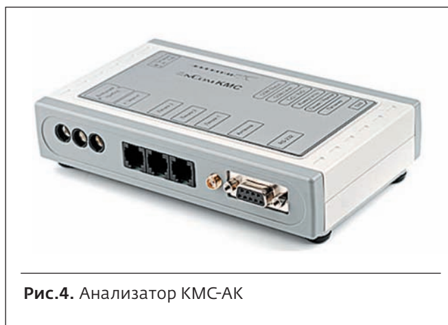
Рис.4. Анализатор КМС-АК

Модернизация технологии эксплуатации требует уже не универсального электромонтера, а интеллектуального – не только умеющего выполнять все виды традиционных работ, но и работающего в рамках