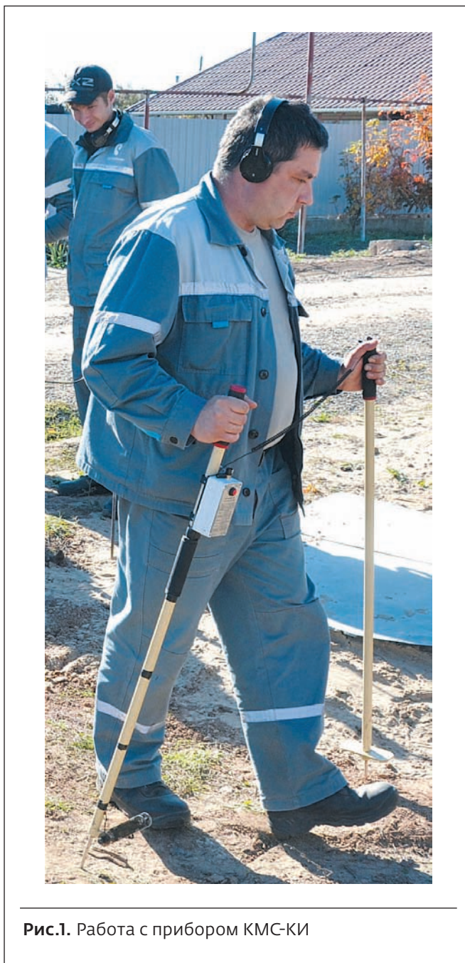
Рис.1. Работа с прибором КМС-КИ

Прибор (рис.1) имеет две штанги: активная оснащена антенной и щупом, а пассивная – только щупом. Сигналы поиска, голосовое меню и результаты измерений выводятся на беспроводные Bluetooth-наушники. Режимы поиска легко и быстро переключаются кнопкой, что позволяет монтеру одновременно определять трассу индуктивным методом и находить ее неисправности контактным методом. Приемник размещен непосредственно на активной штанге, поэтому вся конструкция прибора получилась легкой и удобной, в ней всего лишь один провод, соединяющий штанги. Все режимы работы приемника переключаются и настраиваются одной кнопкой с помощью голосового меню. Селективный режим