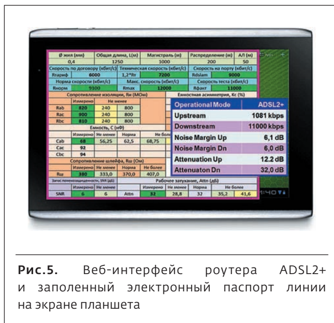
Рис.5. Веб-интерфейс роутера ADSL2+ и заполненный электронный паспорт линии на экране планшета

Применение универсальных современных средств информационных технологий (телефон, смартфон, наушники и планшет) обеспечивает и гибкость создаваемого решения, и доступную цену комплекта, и инновационность технических решений, опирающуюся на использование современных технологий и радиointерфейсов (GSM, 3G,